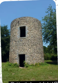
© Moulin à vent de La Ville Gouin